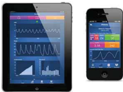
Figuur 2. Biofeedback met Inner Balance

heel concreet! Al bij een eerste kennismaking met de apparatuur zie je dat de hartcoherentie-technieken je hartslag rustiger en ritmischer maken. Dit motiveert erg en stimuleert ook om de technieken in de praktijk te gaan toepassen. En daar gaat het uiteindelijk om.